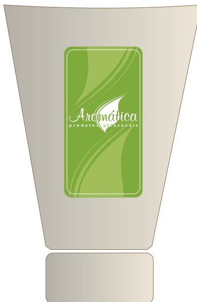
Aplicação em rótulo