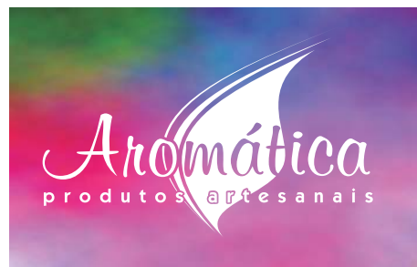
Aplicação em fundo escuro